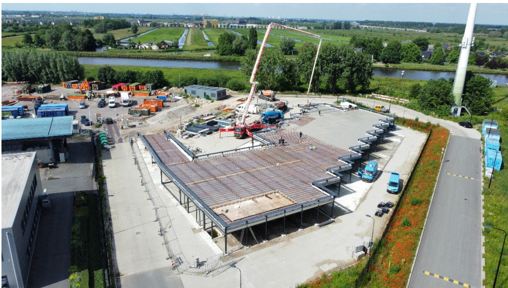
Afbeelding: situatie Ecopark anno 2024.

De gemeente Gouda bezit een Afvalbrengstation (ABS). Dit ABS wordt in opdracht van de gemeente geëxploiteerd door een commerciële exploitant, Cyclus N.V. Het nieuwe Ecopark wordt gebouwd in opdracht van de gemeente Gouda. De gemeente blijft ook na oplevering eigenaar van het Ecopark. Cyclus N.V. zal het nieuwe Ecopark exploiteren. Vanuit de gemeente is afdeling Beheer Openbare Ruimte (BOR) verantwoordelijk voor de relatie met de exploitant. De gemeente vergoedt de exploitant voor zijn prestaties. Tijdens de bouw van het Ecopark wordt gebruikgemaakt van een tijdelijk ABS. Deze is gelegen aan de Goudkade 25, op een deel van het terrein waar ook het nieuwe Ecopark wordt gerealiseerd. Na de ingebruikname van het nieuwe Ecopark wordt de grond van het tijdelijke ABS opgeleverd aan een naastgelegen bedrijf (Gouda Refractories) dat de grond reeds in 2018 van de gemeente heeft gekocht.